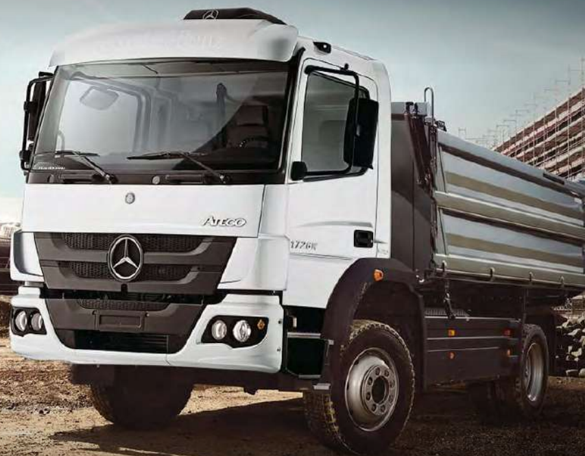
Imagen de referencia, consultar equipamiento.