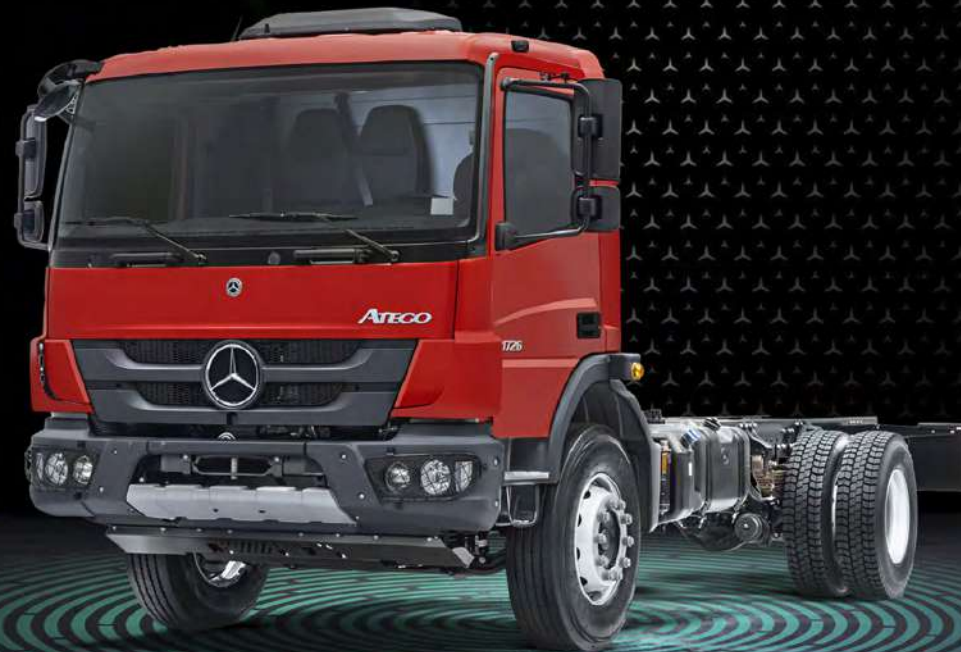
Imagen de referencia, consultar equipamiento.